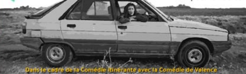
Dans le cadre de la Comédie Itinérante avec la Comédie de Valence