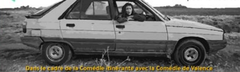
Dans le cadre de la Comédie Itinérante avec la Comédie de Valence